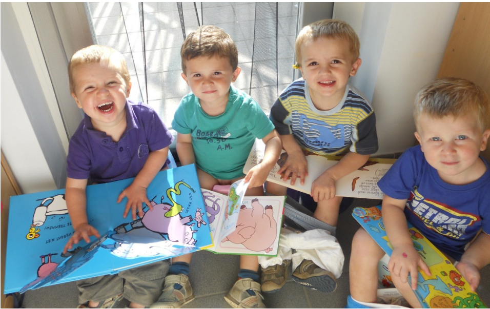
Onze grote jongens lezen al graag eens een boekje op de pot! ☺